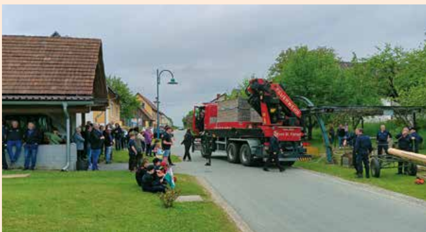
Maibaumaufstellen 2024 in Kraubath

Das Maibaumaufstellen ist schon seit Jahren ein fixer Programmpunkt im Veranstaltungskalender der Freiwilligen Feuerwehr