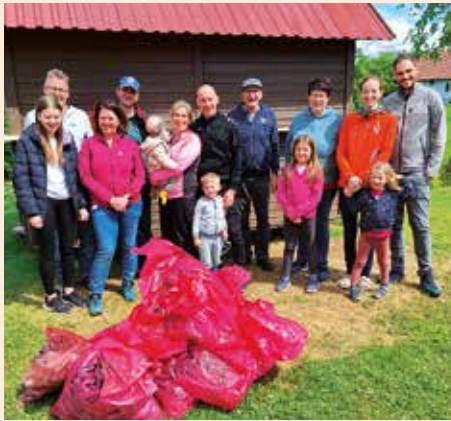
Der Verein Riegldorf Nassau-Guglitz nahm auch in diesem Jahr am „Steirischen Frühjahrsputz“ teil