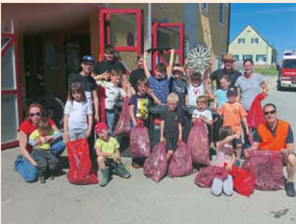
Feuerwehrjugend Kraubath und solche, die's noch werden wollen – insgesamt 20 Personen und ca. 12 befüllte Müllsäcke

Ich bedanke mich bei allen, die sich bei der heurigen Flurreinigung beteiligt haben und sich vorbildlich für eine saubere und lebenswerte Umwelt in unserer Marktgemeinde einsetzen, recht herzlich!