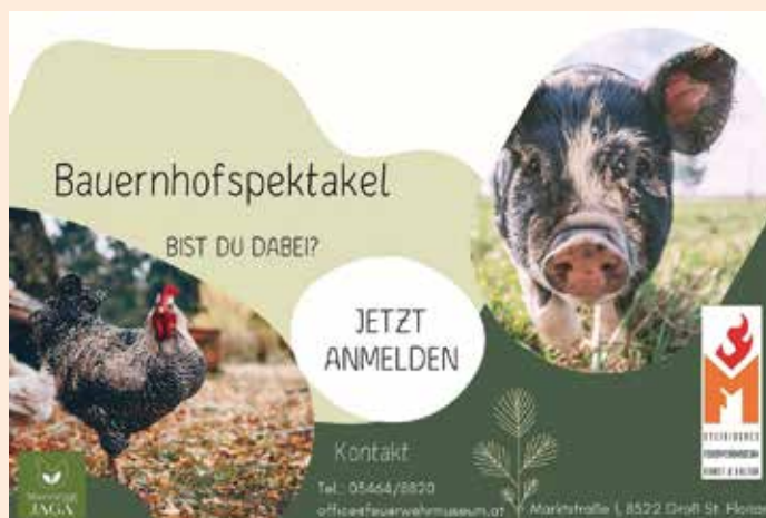
Kreative Ferientage