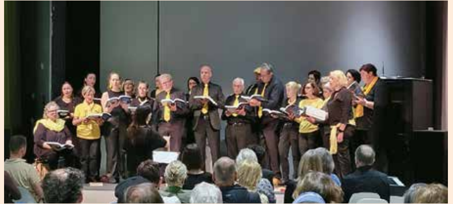
Auftritt im „SPACE04“ im Kunsthaus Graz

Ebenso erfreulich wie entspannend fand der heurige Chorausflug nach Istrien statt. Mit dem Bus ging es von Groß Sankt Florian nach Novigrad , wo wir wunderbar direkt am Meer untergebracht waren. Am nächsten Tag fand ein Ausflug nach Rovinj samt Stadtführung, eine Bootsfahrt zu den vorgelagerten Inseln und dem Limski Fjord sowie