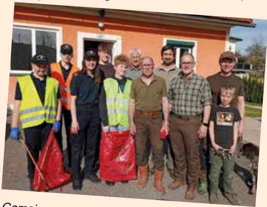
Gemeinsam unterwegs: Die Jägerschaft und die Feuerwehrjugend aus Michlgleinz