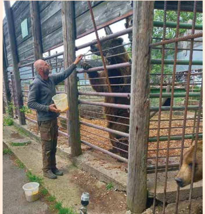
Fütterung bei einem Bärengehege