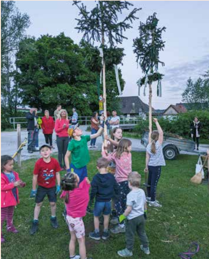
Hurra – die Maibäume der Kinder sind aufgestellt