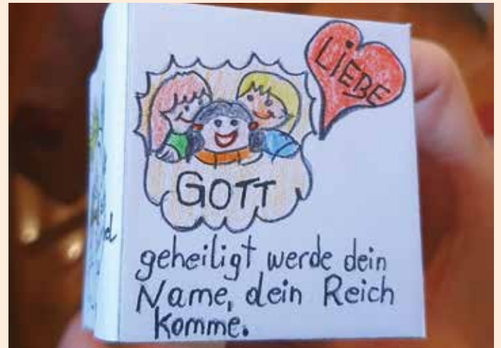
Ein von Karin Recher gestalteter Gebetswürfel

Im Anschluss an diese Maiandacht fand am Vorplatz der Kapelle die ebenfalls bereits zur Tradition gewordene Agape statt, um den Nachmittag bei gutem Wetter in freundlich – gesprächiger Atmosphäre bei Getränken und Jause mit selbst gemachten Aufstrichen und Brot ausklingen zu