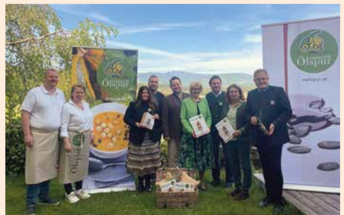
Pressekonferenz im Gasthof Martinhof in St. Martin im Sulmtal