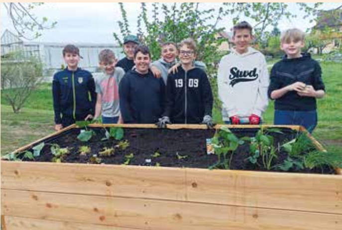
Ein Hochbeet für die Mittelschule Groß Sankt Florian

Die Schüler der vierten Klassen haben im Rahmen des Werkunterrichts ein Hochbeet für die Schule errichtet. Im Schwerpunkt „Cook and Move“ setzten die Drittklässler verschiedene Pflanzen, wie Paprika und Zucchini, ein. Schon in wenigen Wochen kann das erste Gemüse geerntet und in der Schulküche verarbeitet werden. Ein besonderer Dank gilt der Marktgemeinde Groß Sankt Florian, die uns bei diesem Projekt tatkräftig unterstützt hat.