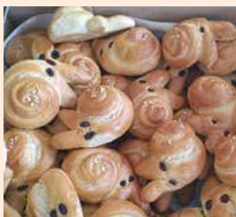
Germteighasen als Osterüber- raschung

Heuer durften wir wieder bei traumhaftem Wetter den AUVA-Radworkshop unterstützen. Dieser Workshop lehrt die Kinder den sicheren Umgang mit dem Rad sowie die wichtigsten Punkte zur Verkehrssicherheit eines Fahrrades. Der Workshop war wie jedes Mal sehr interessant und die Kids hatten viel Spaß dabei, da sie bei einem teils anspruchsvoll aufgebauten Parcours am Parkplatz vor dem Pfarrheim ihr Gleichgewicht am Rad und ihre Geschicklichkeit verbessern konnten.