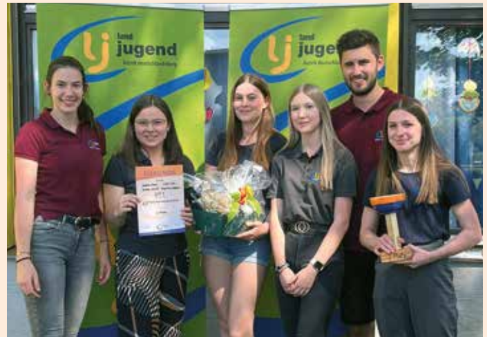
Sieger des 4x4 Wettbewerbes

B eim 4x4 Bezirksentscheid im April war wieder kluges Köpfchen gefragt. Themen wie Greifvögel, Thermalwelt, Demokratie und vieles mehr standen dabei am Pro-