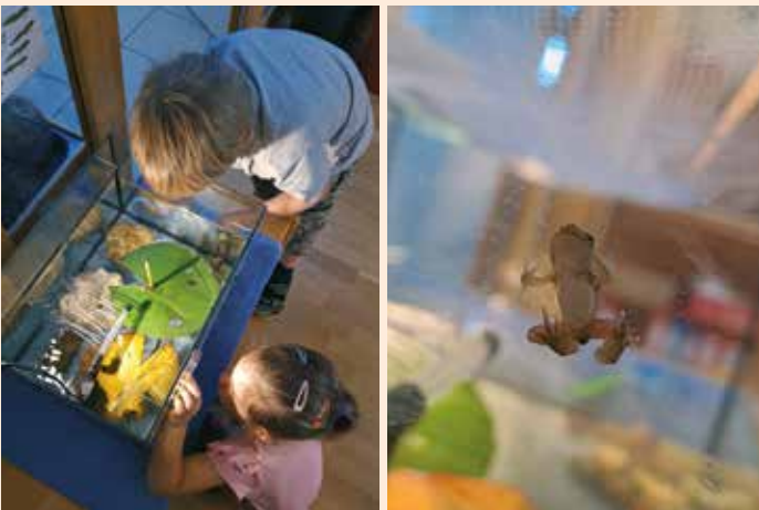
Beobachten der verschiedenen Stadien der Froschentwicklung

Auch ein Spiegelkarpfen war auf Kurzbesuch im Kindergarten. Die Kinder konnten live beobachten, wie sich seine Flossen bewegten, wie er durch die Kiemen atmete und dass er ständig Sauerstoff brauchte. Wir konnten aufgrund vieler Plakate und Bücher erfahren, wie der Fisch den Sauerstoff über das Wasser aufnimmt. Die Faszination im Wasser atmen zu können, findet in den Fantasien der Kinder großen Anklang. Viele Kinder würden gerne so lange tauchen können, aber dann doch lieber in einem Wasser, das durchsichtiger ist, als ein Teichwasser. Als Abschluss dieses interessanten Themas ist noch ein Teichbesuch geplant. Wer weiß, was es da noch zu entdecken gibt?