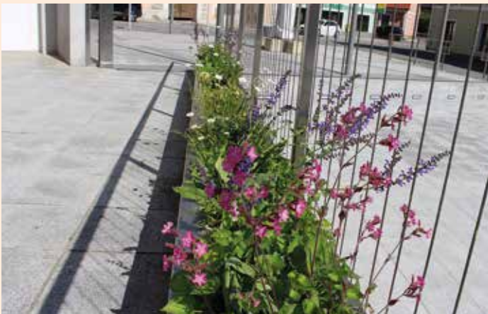
Wildblumen und Wildkräuter erblühen am Ing. Kurt Bauer-Platz

Schon einige Jahre beteiligt sich Groß Sankt Florian an der Aktion Wildblumen mit blühenden und summenden Paradiesen vor der Haustüre. Natürliche Wildblumenflächen und Blühstreifen sind wertvolle Lebensräume für Bienen und andere Insekten. Die Aktion Wildblumen wird als LE Projekt vom Land Steiermark und der EU unterstützt.