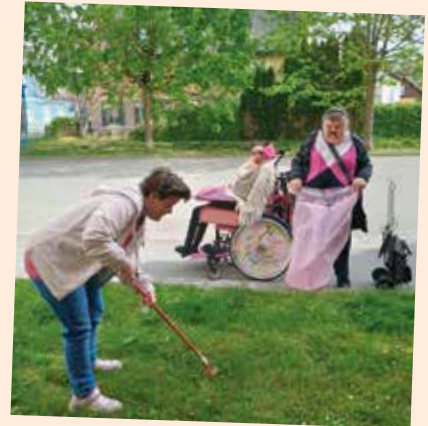
Die Bewohner vom Malvenhof engagierten sich ebenfalls für die Umwelt