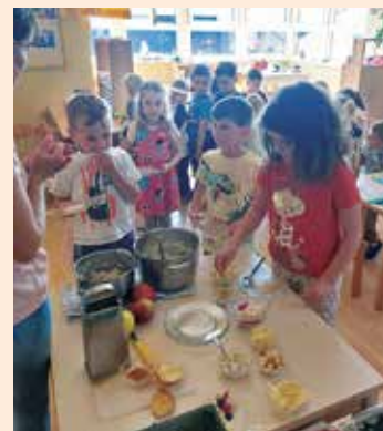
Der köstliche Brei kann verspeist werden

E rnährung ist ein wichtiger Bestandteil einer gesunden Entwicklung der Kinder. In den letzten Wochen beschäftigten sich die Kinder intensiv mit der Lebensmittelkunde , dem gemeinsamen Zubereiten von Speisen und dem anschließenden Schmecken und Verkosten. An unseren gemeinsamen Kochtagen gab es gesunde Jausenbrote, gefüllte Wraps, Porridge und Grießbrei.