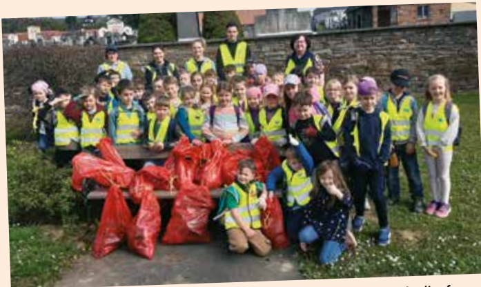
Die Volksschulkinder sammelten im Bereich des Friedhofes weggeworfenen Müll