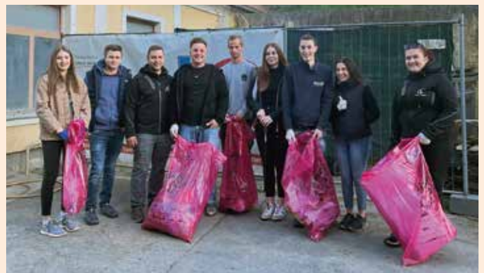
Müllsammelaktion der Landjugend Groß Sankt Florian