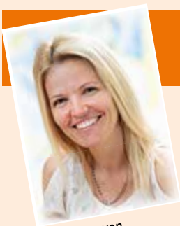
von Stefanie Theisl (Leiterin)