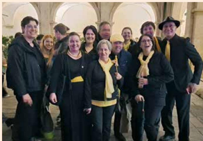
Im Landhaushof Graz