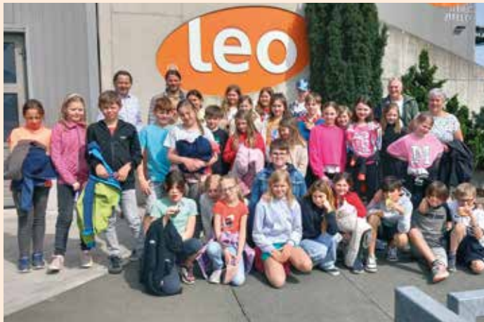
Die Volksschule zu Besuch bei „Leo Möbeldesign“

In diesem Schuljahr konnten unsere Schüler wieder Betriebe in Groß Sankt Florian besichtigen. Spannend waren die Einblicke in den Betrieb Leo Möbeldesign . Anschaulich wurde ihnen der Weg von der Planung bis zur