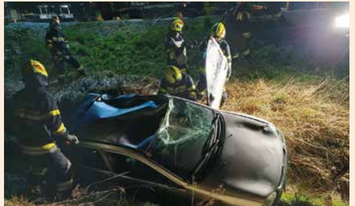
Auch ein Verkehrsunfallsszenario wurde geübt