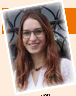
von Anna Stelzer (Pressereferentin)