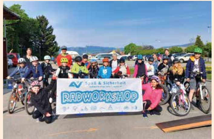
„AUVA-Radworkshop“ – Spaß und Sicherheit

W ie stelle ich meinen Fahrradhelm richtig ein? Wie bremsen ich richtig? Wie überquere ich Hindernisse mit meinem Fahrrad sicher?