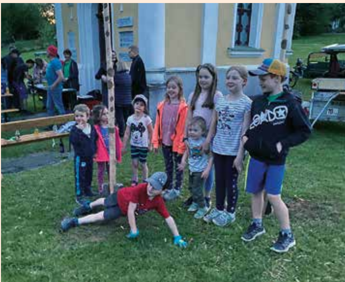
Große Begeisterung bei den mitwirkenden Kindern