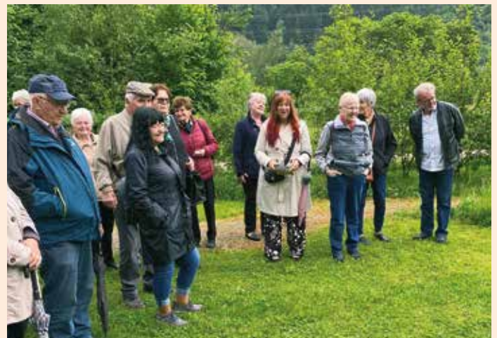
Interessierte Zuhörer beim Rundgang in den „Naturwelten“

Es ist mittlerweile lieb gewordene Tradition, im Mai zum Anlass Mutter- und Vatertag im Zuge einer Ausfahrt zu einem gemeinsamen Essen einzuladen. Diesmal ging der Vorstand von der Überlegung aus, zum gemeinsamen Essen in der Heimat – im Landhaus Oswald-Edler – einzuladen, damit auch jene Mitglieder unseres Seniorenbundes, die an Busausflügen nicht mehr teilnehmen können, die Möglichkeit haben, die Einladung zum gemeinsamen Essen anzunehmen. Mit dem Bus wurde bei einem Vormittagsausflug das von der Steirischen Jägerschaft initiierte Projekt „ Naturwelten Steiermark “ in Mixnitz besucht. Dieses Thema weckte so großes Interesse, dass zum 50er-Bus auch noch ein Kleinbus aufgenommen werden musste, denn 58 Mitglieder wollten sich den Besuch der