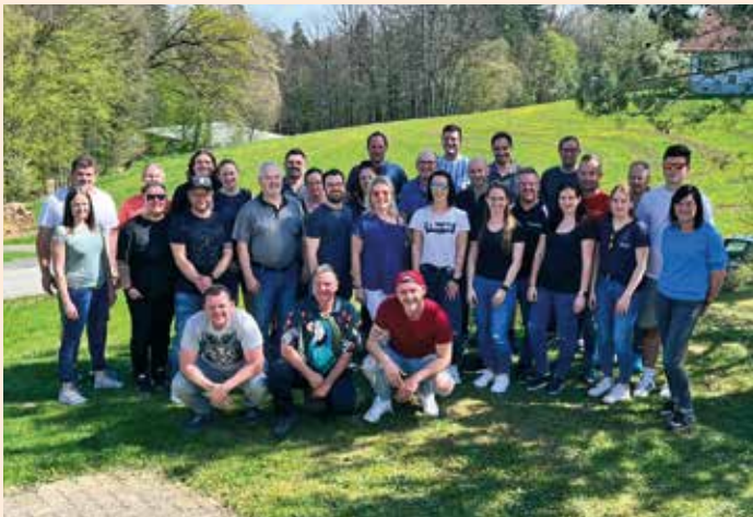
Die Teilnehmer des 10. Riegltdorf-Dartturniers