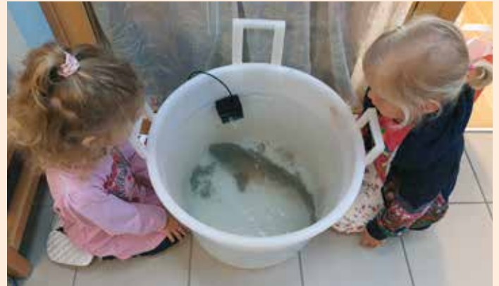
Spiegelkarpfen auf Besuch

Unsere Kaulquappen , die sich in unserem Aquarium tummelten, begannen sich bereits zu Fröschen zu entwickeln. Mit Lupen ausgestattet, wurden die einzelnen Stadien der Froschenzyklopädie im Kindergartenalltag erforscht. Als alle Frösche ausgewachsen waren, wurden sie von uns in Wiesen und Tümpel in die Freiheit entlassen.