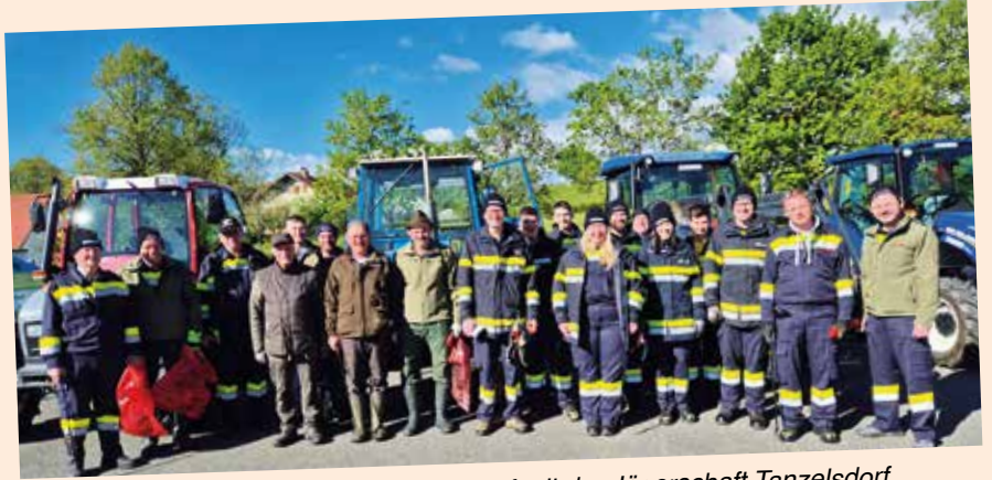
Müllsammlung der FF Tanzelsdorf mit der Jägerschaft Tanzelsdorf