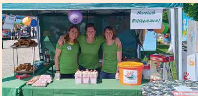
Elternvereinsstand am Florianimarkt