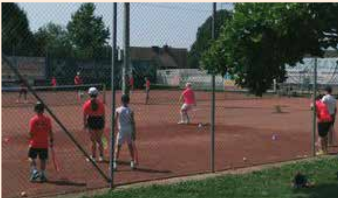
Auch heuer wieder, volles Programm bei den Kindercamps

Besonderes Augenmerk wird im Verein auf die Jugend gelegt. Fünf Mannschaften werden heuer an den Mann-