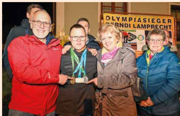
Die Marktgemeinde gratulierte recht herzlich