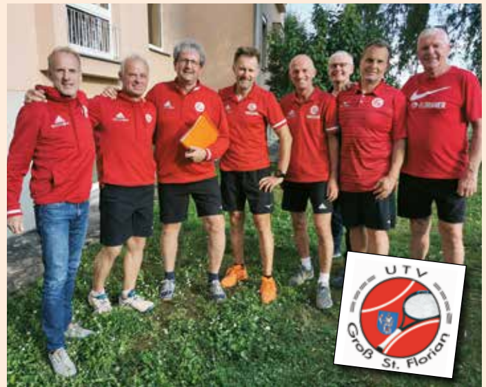
Die +45er, ein altbewährtes Team

schaftsmeisterschaften teilnehmen. Der vorjährige Meistertitel der U15 Mannschaft zeigt, dass das Projekt Laßnitzer Tennisjugend mit den Vereinen Groß Sankt Florian, Michlgleinz und Wettmannstätten ein guter Weg ist, um Jugendliche für Tennis zu begeistern.