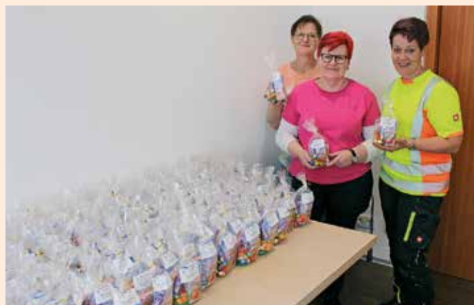
Vielen Dank für euren Einsatz