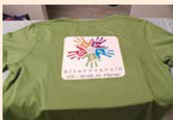
Unsere neuen Leiberln