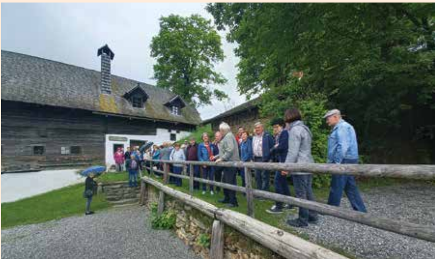
Vor dem Rauchstubenhaus in Anger