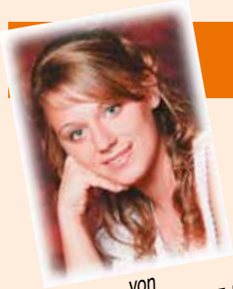
von Alexandra Posch, BEd (Pressereferentin)