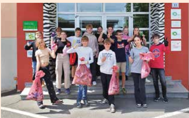
Auch eine Gruppe von der Mittelschule beteiligte sich an der Müllsammelaktion