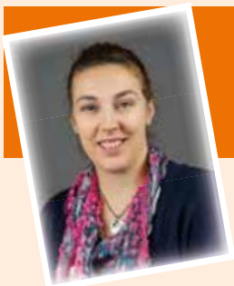
von Michaela Teppernegg (Leiterin)