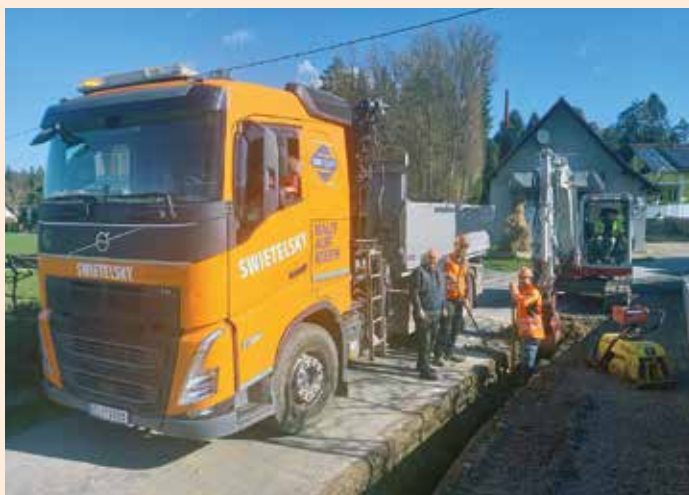
Grabungsarbeiten in der KG Vochera

Ein Erlebnis in Vochera war das Aufstellen des Maibaums vom ESV Vochera . Erstmals wurden von den vielen Kindern aus unserer Marktgemeinde zwei Kindermaibäume bei der Dorfkapelle aufgestellt. Eine große Kinderschar war mit großer Begeisterung und handwerklichem Geschick dabei, die beiden Maibäume selbst zu schnitzen und – mit Kränzen und Bändern versehen – selbst aufzustellen. Ein großer Dank geht an die Familie Mandl für die Spende aller drei Maibäume. Die Kinder freuen sich bereits auf das Umschneiden und Versteigern der Maibäume, wozu wieder alle eingeladen sind.