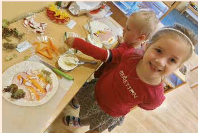
Wir sind fleißig beim Schneiden und Belegen der gesunden Jause

Gemeinsam mit der bekannten „ Raupe Nimmersatt “ beschäftigten sich die Kinder mit den Fragen: Was ist gesund/ ungesund? Wie schmecken die unterschiedlichen Lebensmittel? Wie fühle ich Hunger bzw. wann merke ich, dass ich satt bin? Wie beschreibe ich meine Bauchschmerzen? Wie esse ich eigentlich richtig? Das Märchen „ Der süße Brei “ stimmte uns auf ein warmes Frühstück ein. Die Vorstellung, dass sich der Brei über den ganzen Kindergarten und durch Groß Sankt Florian ausbreiten könnte, brachte viele Kinder zum Lachen.