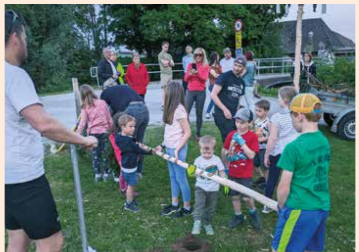
Die Kinder beim Aufstellen des Maibaumes