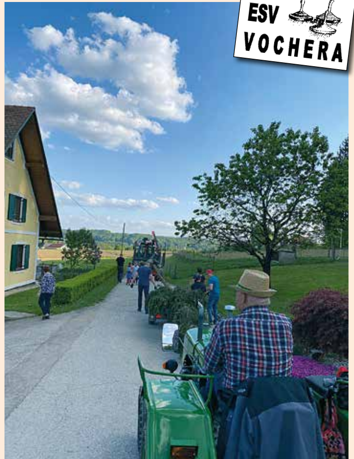
Anlieferung des Maibaumes