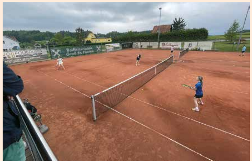
Doppelpaarung / Doppelspiele