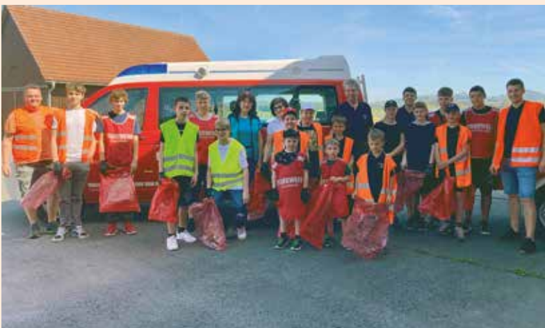
Auch in der Katastralgemeinde Gussendorf engagierte man sich für ein sauberes Groß Sankt Florian