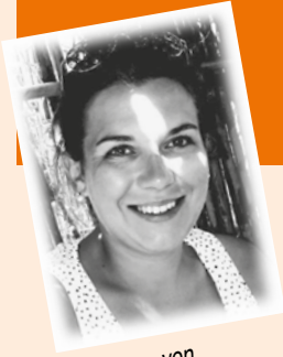
von Verena Steinwender (Schriftführerin)

Wie in der letzten Ausgabe berichtet, wurde über den Winter die Kantine umgebaut. Bis Ende April konnte der Umbau (Vergrößerung und Dämmung der Kantine) abgeschlossen werden. Aufgrund dessen veranstalteten wir am 01., 03. und 04. Mai 2024 zum Saisonauftritt