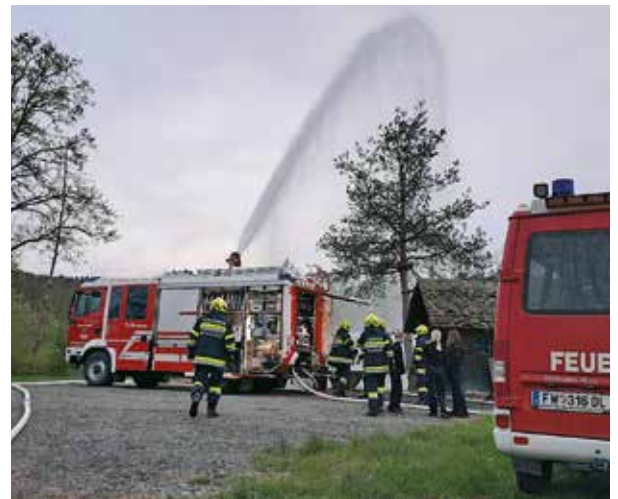
Monatsübung beim „Puchner-Teich“ in Unterbergla