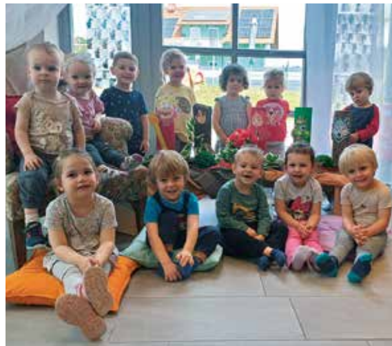
Kinder bei den kreativen Tätigkeiten | Wir freuen uns auf unser Märchenfest