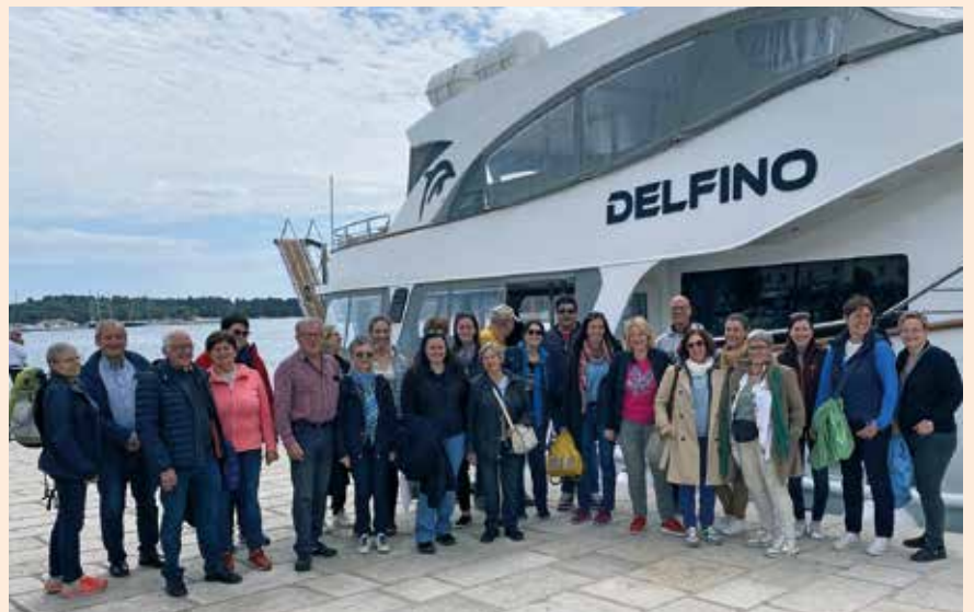
Gruppenfoto in Rovinj beim Chorausflug 2024 (Istrien)