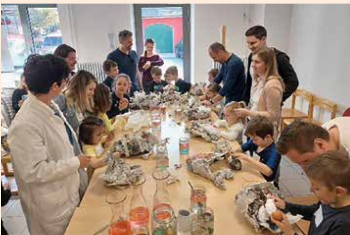
MINT: Eierschalen sind härter als gedacht

in die Bücherei ein. Holen Sie sich Ihre Buchstarttasche und lernen Sie die Bücherei und unser Angebot schon für die ganz Kleinen kennen – für einen Bilderbuchstart ins Leben!