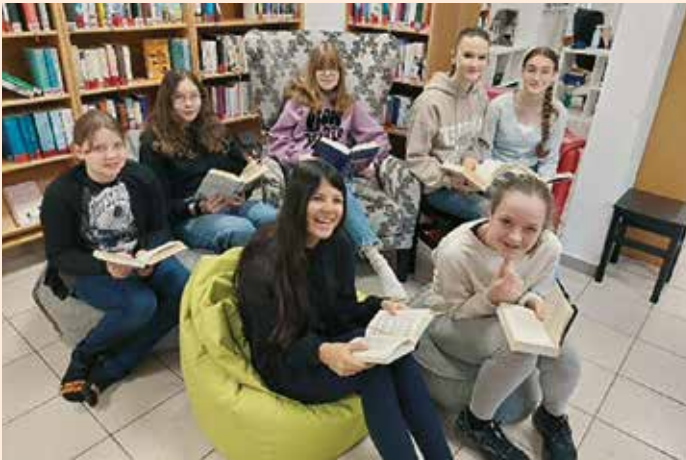
Jugendliche: Neuer Schwung mit dem Jugendteam

Bei unserer MINT-Veranstaltung im Frühling drehte sich alles ums „Ei“. Bei lustigen Versuchen konnte man spielerisch in die Welt der Naturwissenschaften eintauchen.