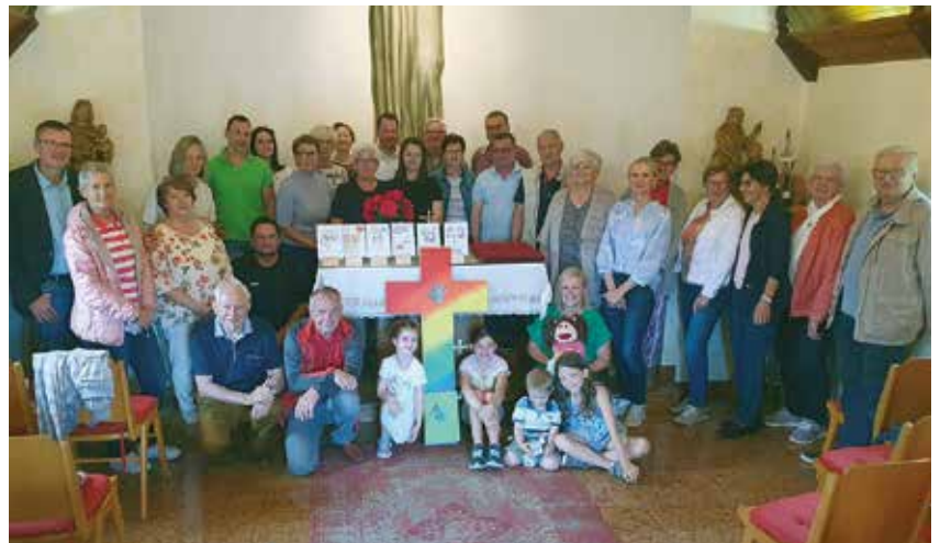
Gruppenfoto in der Kapelle