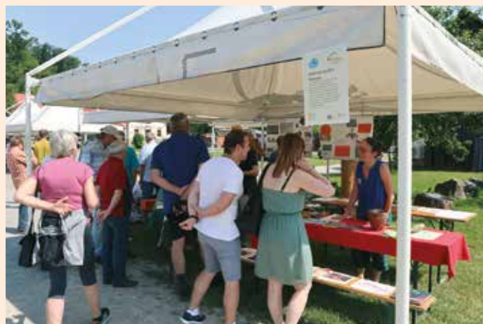
Fest der ArchaeoRegion Südweststeiermark

Am 08. Juni nahmen wir zum dritten Mal am „ Fest der ArchaeoRegion Südweststeiermark “ im Besucherzentrum Grottenhof teil. Bei unserer Mitmach-Aktion begaben wir uns auf eine Zeitreise zu den Römern, genauer in den