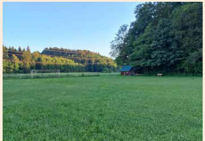
Sportplatz in Hasreith/Unterbergla

Die Fläche für den Sportplatz in Hasreith wird weiterhin von der Marktgemeinde gepachtet. Die Außendienstmitarbeiter haben bereits mit den Mäharbeiten und der Pflege des Platzes begonnen. Es freut mich, dass die Fläche der Bevölkerung zur Verfügung steht. Der Volks- und Mittelschule bietet sich dieser schöne Platz als Raststation im Rahmen eines Wandertages an. Viel Freude bei der sportlichen Betätigung!