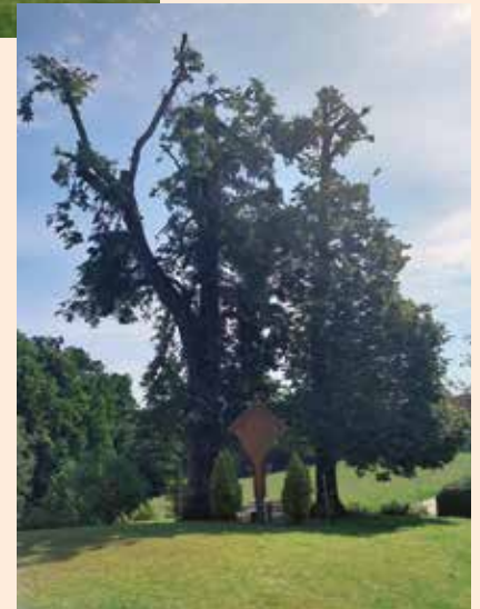
Frisch gestutzt ... die Linden nach dem Baumschnitt

In unmittelbarer Nähe zum Vereinshaus befinden sich zwei spalterstehende Bäume beim Dorfkreuz, die so manche Geschichte erzählen könnten. Der Zahn der Zeit blieb auch hier nicht stehen und so standen wir vor der schweren Entscheidung, ob wir die mindestens 200 Jahre alten Bäume fällen müssen. Mittlerweile sind die Bäume für unser Dorf ein