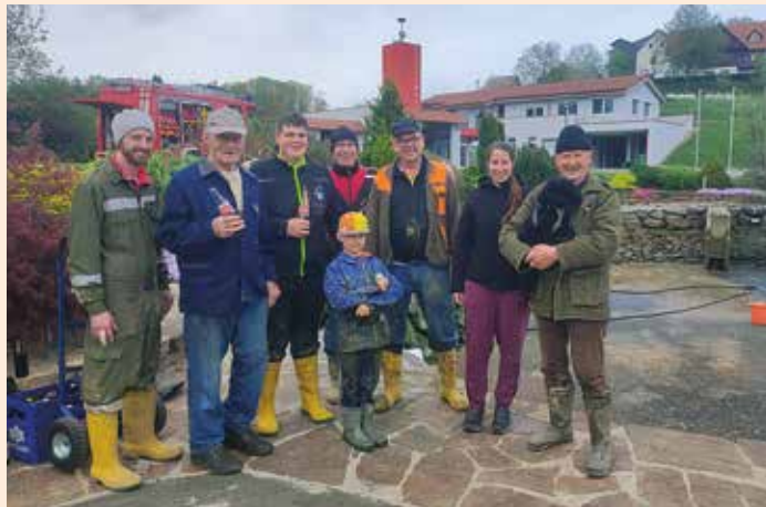
Team Löschteichreinigung

Nach der Teilnahme an der Gemeindeübung in Gussendorf am 22.03.2024 stellten wir am 29.03.2024 traditionell beim „Veitl-Riegl“ das Osterkreuz unter dem bewährten Kommando von unserem Karl Bretterkieber auf. Am 30.03.2024 rückten wir zu einem vermeintlichen Brandereignis im