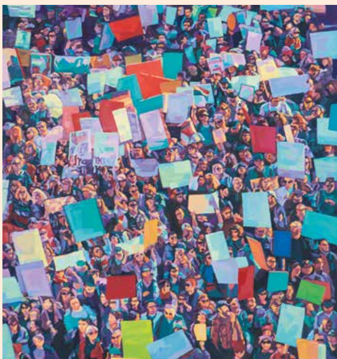
Sujet Ornament der Masse IV, 2020

Erlebe spannende, kreative und tierische Tage rund um das Thema Bauernhof. Nachdem du deiner Kreativität freien Lauf gelassen hast, verbringen wir noch einen abenteuerlichen Tag am Manneggjaga-Hof und lassen die Woche dort ausklingen. Aber auch die Feuerwehr kommt nicht zu kurz. An einem Tag gehen wir mit Spiel und Spaß der Frage nach „Was macht die Jugendfeuerwehr?“. Mehr Informationen auf: www.feuerwehrmuseum.at !