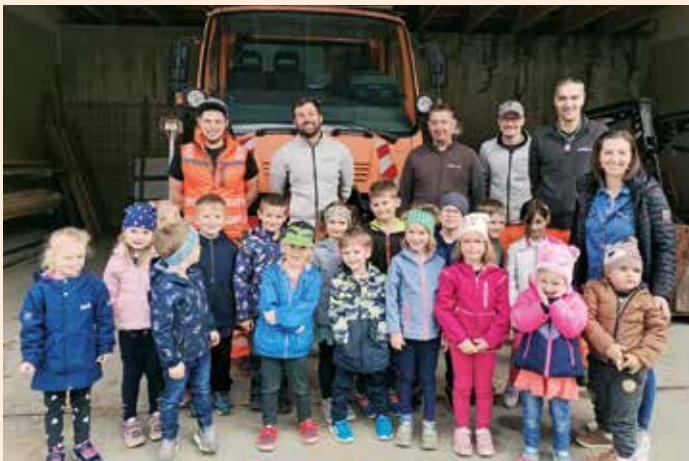
Danke an das Team der Außendienstmitarbeiter

Für viele Kinder war das ein ganz besonderer Moment. Herzlichen Dank an die Kollegen im Außendienst für eure Zeit!