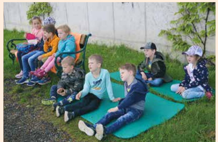
Lesewanderung: Die Geschichten der Hexe Zilly sind einfach spannend