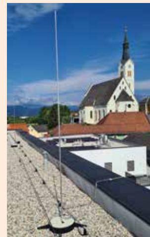
Blitzschutzanlage am Dach des Rathauses

Wohngebäude bis zu zwei Wohneinheiten – mindestens alle zehn Jahre. Wohngebäude mit mehr als zwei Wohneinheiten (z. B. Reihenhäuser) und landwirtschaftliche Gebäude – mindestens alle fünf Jahre.