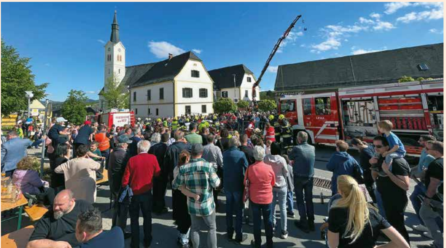
Zahlreiche Besucher beim Sicherheitstag in Groß Sankt Florian