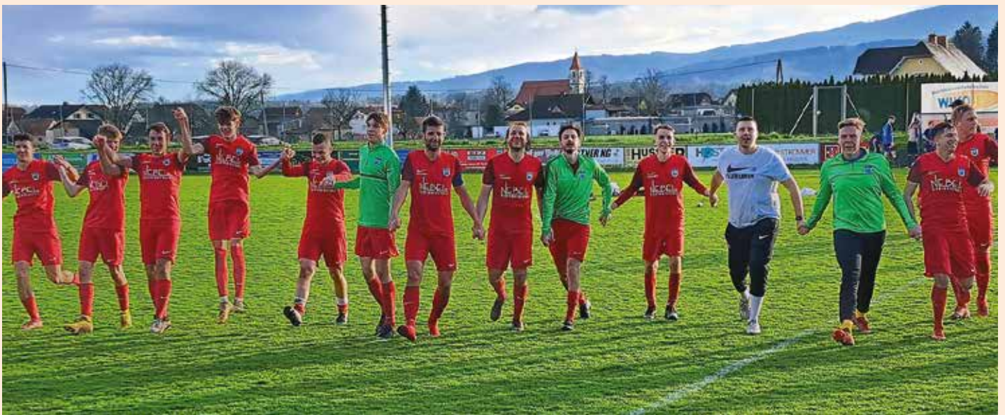
Die Kampfmannschaft nach einem Sieg