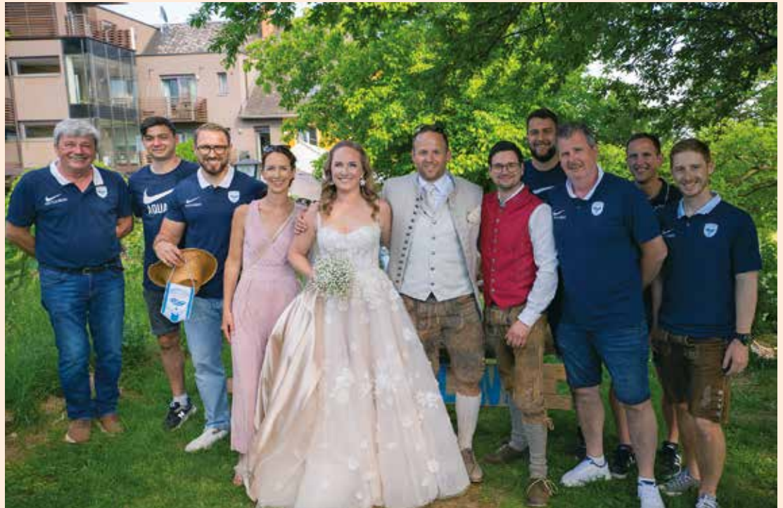
Der HC Aqua-line beim Absperren

Z u Beginn der Frühjahrsaison war die Ausgangslage klar. Der HC Aqua-line startete als Tabellenführer in die Rückrunde. Gleich am ersten Spieltag empfangen wir den Titelverteidiger Wettmannstätten. Durch eine starke Mannschaftsleistung konnte ein 3:0 Sieg gefeiert werden. Auch in der zweiten Runde gegen Gratwein-Straßengel gingen wir mit einem 4:1 als Sieger vom Platz. Beim