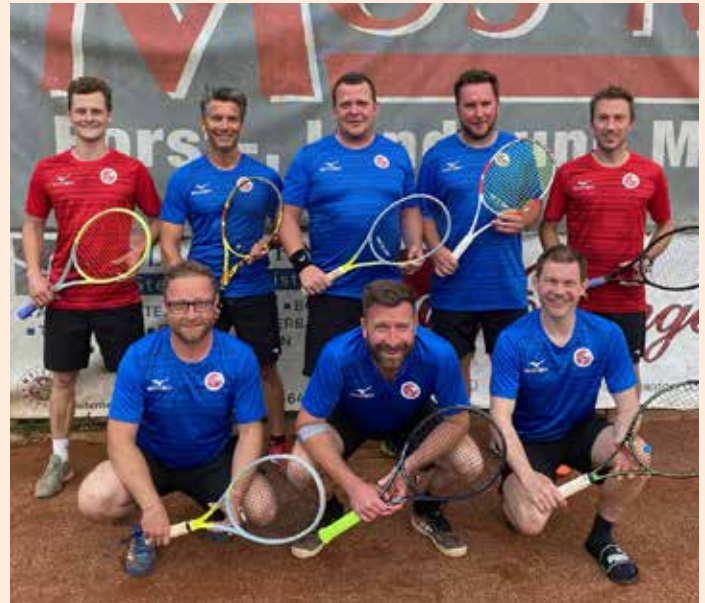
Die 1er, mit zwei Siegen in die Meisterschaft gestartet, mit den neuen Dressen von 11 Teamsports