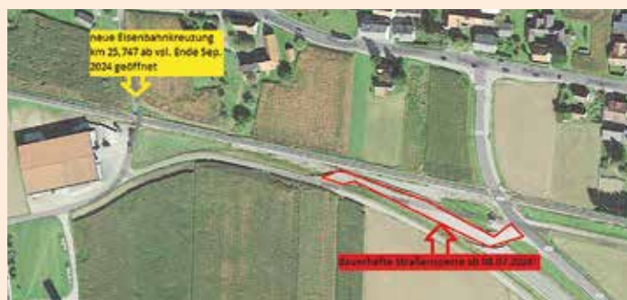
Maßnahmenlageplan Krottendorf

Die Zufahrt nach Krottendorf kann von Groß Sankt Florian (L601) kommend über die „Lebinggleinzstraße“ sowie über den Bahnbegleitweg „Krottendorf“ stattfinden. Die Zufahrt von Frauental (L601) kommend kann über die Straßen „Unterer Bahnweg“ und „Zeierlingerstraße“ erfolgen. In dieser Zeit wird die „alte Eisenbahnkreuzung“ ertüchtigt und zu einem technisch gesicherten Bahnübergang mit Ampel- und Schrankenanlage ausgebaut. Dieser geht voraussichtlich laut der „Graz-Köflacher Bahn und Busbetrieb GmbH“ Ende September in Betrieb.