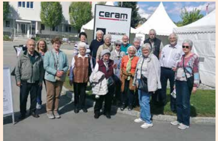
Einige Mitglieder des Pensionistenverbandes Groß Sankt Florian besuchten den Tag der offenen Tür der CERAM Austria

In seinem über 100-jährigen Bestehen hat das Unternehmen lange Erfahrung in der Herstellung von technischer Keramik gesammelt.