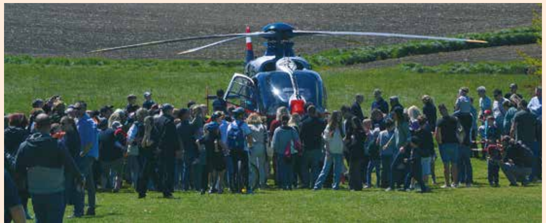
Hubschrauberlandung der Polizei