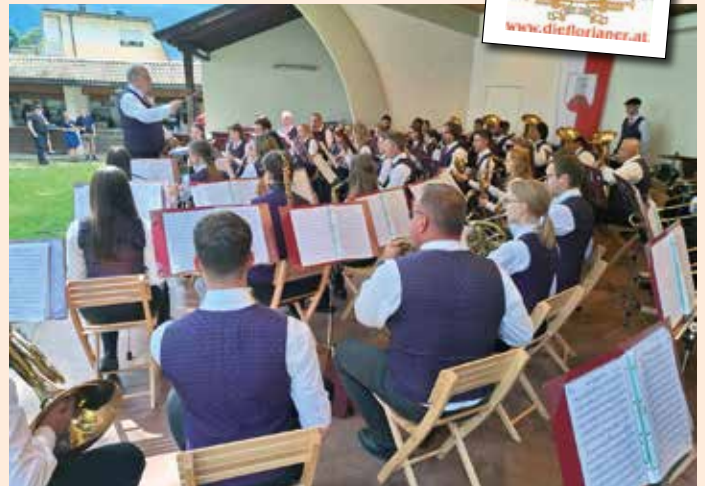
Musikgruppe in Gargazon (Südtirol)

Besonders der stimmungsvolle Abschluss mit dem „holladuo“ sorgte bei uns Florianern für Begeisterung und lud dazu ein, das Tanzbein zu schwingen. Am Montag traten wir eine etwas ruhigere Rückreise an. Die Reise nach Südtirol war ein voller Erfolg und bleibt uns sicherlich noch lange in bester Erinnerung.