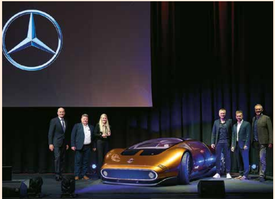
Mercedes Servicetagung in Schladming