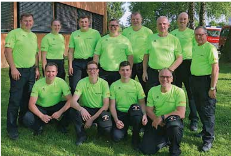
Unsere Wettkampfgruppe bei ihrem ersten Bewerb

Zu guter Letzt darf auch eine Einladung zu unserem „ 3-Tage-Zeltfest “ vom 05. bis 07. Juli 2024 ausgesprochen werden. Für gute Stimmung und das leibliche Wohl wird bestens gesorgt. Wir freuen uns auf Ihren Besuch!