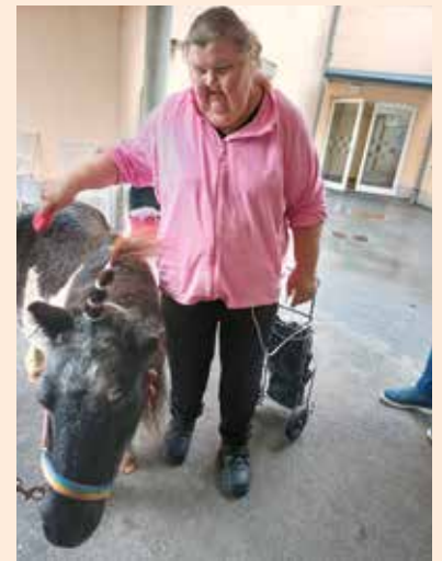
Die Freude über den tierischen Besuch war riesengroß! Spaziergang durch Groß Sankt Florian! Den Ponys wurden lustige und kreative Frisuren verpasst