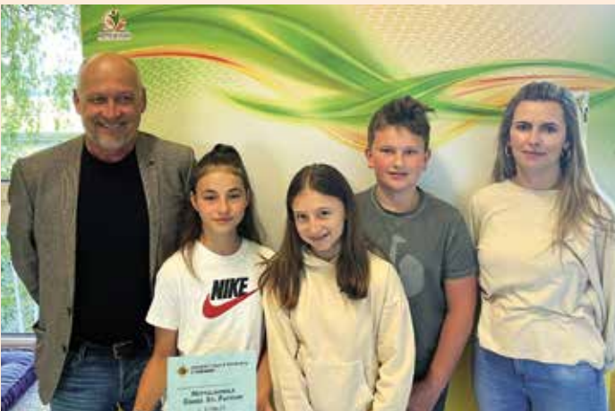
3.795,13 € wurden an der Mittelschule für die Krebshilfe Steiermark gesammelt

Auch heuer startete die österreichische Krebshilfe wieder einen Spendenaufruf an alle Schulen. Die Schüler der Mittelschule Groß Sankt Florian waren besonders eifrig und konnten im Rahmen dieser Sammlung einen stolzen Betrag in Höhe von 3.795,13 € an die Krebshilfe Steiermark übergeben.