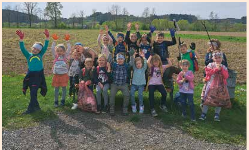
Fröhliche Gesichter bei der Müllsammelaktion